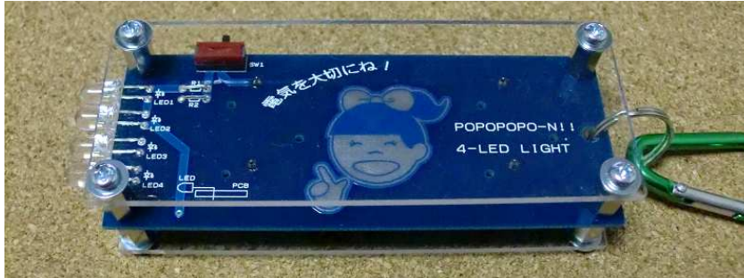
写真1. 基板表 (アクリル板装着時)