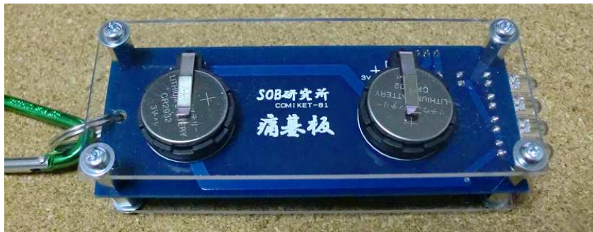
写真2. 基板裏 (アクリル板装着時)