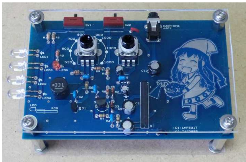
写真1. 基板表(アクリル板装着時)